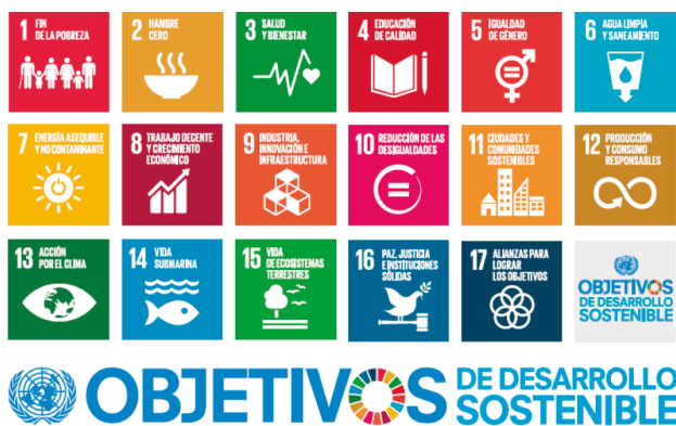
Figura 2. Objetivos de desarrollo sostenible, Agenda 2030

Además, se debe atender la formación de nuevos patrones de consumo y la producción sustentable en la cual todos los sectores puedan participar (Aguilar et al., 2022). En la figura 2 se muestran los 17 ODS, nuevo modelo de DS como lo indica Miranda et al. (2022).